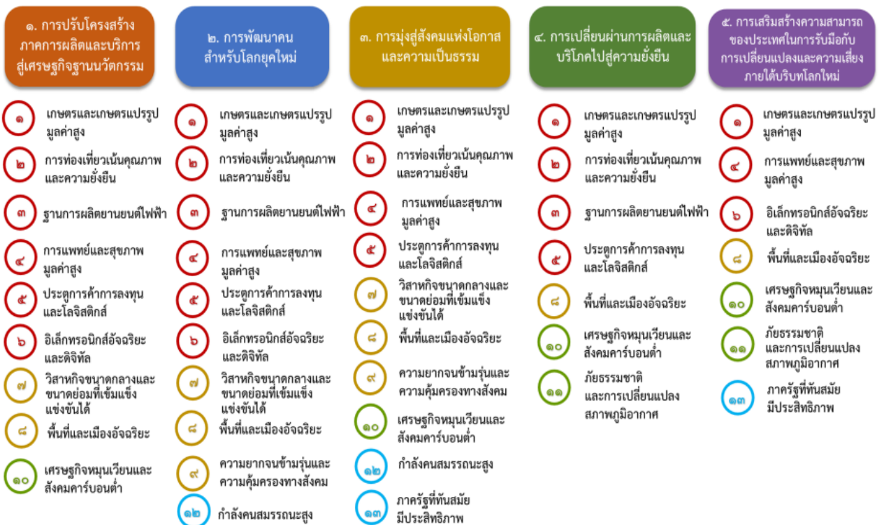
แผนภาพที่ ๓.๑ ความเชื่อมโยงระหว่างหมวดหมู่การพัฒนา กับเป้าหมายหลัก

ความเชื่อมโยงระหว่างหมวดหมู่การพัฒนา กับเป้าหมายหลักแสดงไว้ในแผนภาพที่ ๓.๑ โดยหมวดหมู่การพัฒนาที่กำหนดขึ้นเป็นประเด็นที่มีลักษณะเชิงบูรณาการที่ครอบคลุมการพัฒนาตั้งแต่ในระดับต้นน้ำ จนถึงปลายน้ำ และสามารถนำไปสู่ผลพัฒนาทั้งในมิติเศรษฐกิจ สังคม ทรัพยากรธรรมชาติและสิ่งแวดล้อมไปพร้อมๆ กัน ทำให้หมวดหมู่แต่ละประการสามารถสนับสนุนเป้าหมายหลักได้มากกว่าหนึ่งข้อ นอกจากนี้การพัฒนาภายใต้แต่ละหมวดหมู่ไม่ได้แยกขาดจากกัน แต่มีการสนับสนุนหรือเอื้อประโยชน์ซึ่งกันและกัน